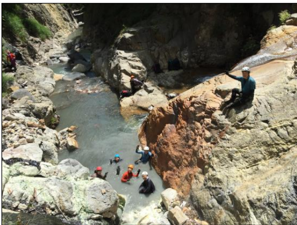
小湯沢にて（温泉・沢登り）

三峰山岳会ホームページ https://www.mitsumine.gr.jp/