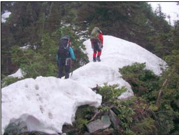
黒部横断 ガンドウ尾根にて