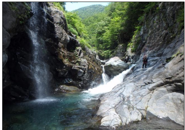
大井川赤石沢にて