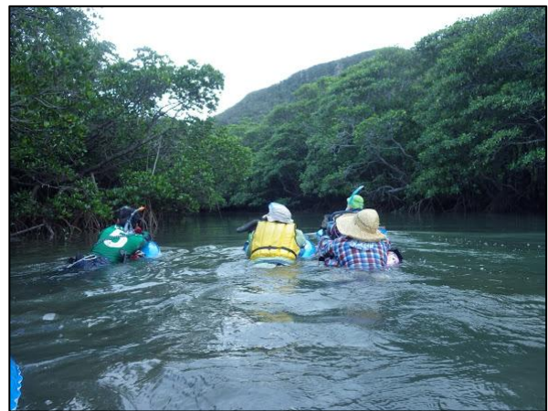
西表島西岸縦走 ジャングル川下り